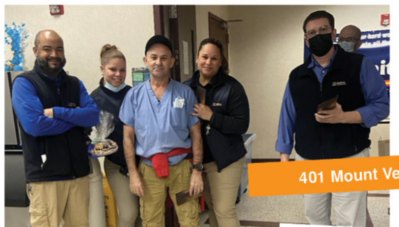
401 Mount Vernon

Group shot of employees who received service awards. ■