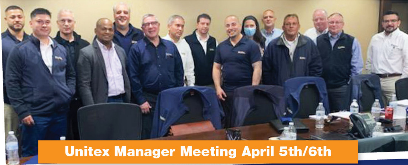
Unitex Manager Meeting April 5th/6th