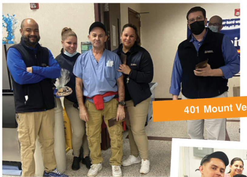
401 Mount Vernon

Fotografía grupal de empleados que recibieron premios por servicio. ■