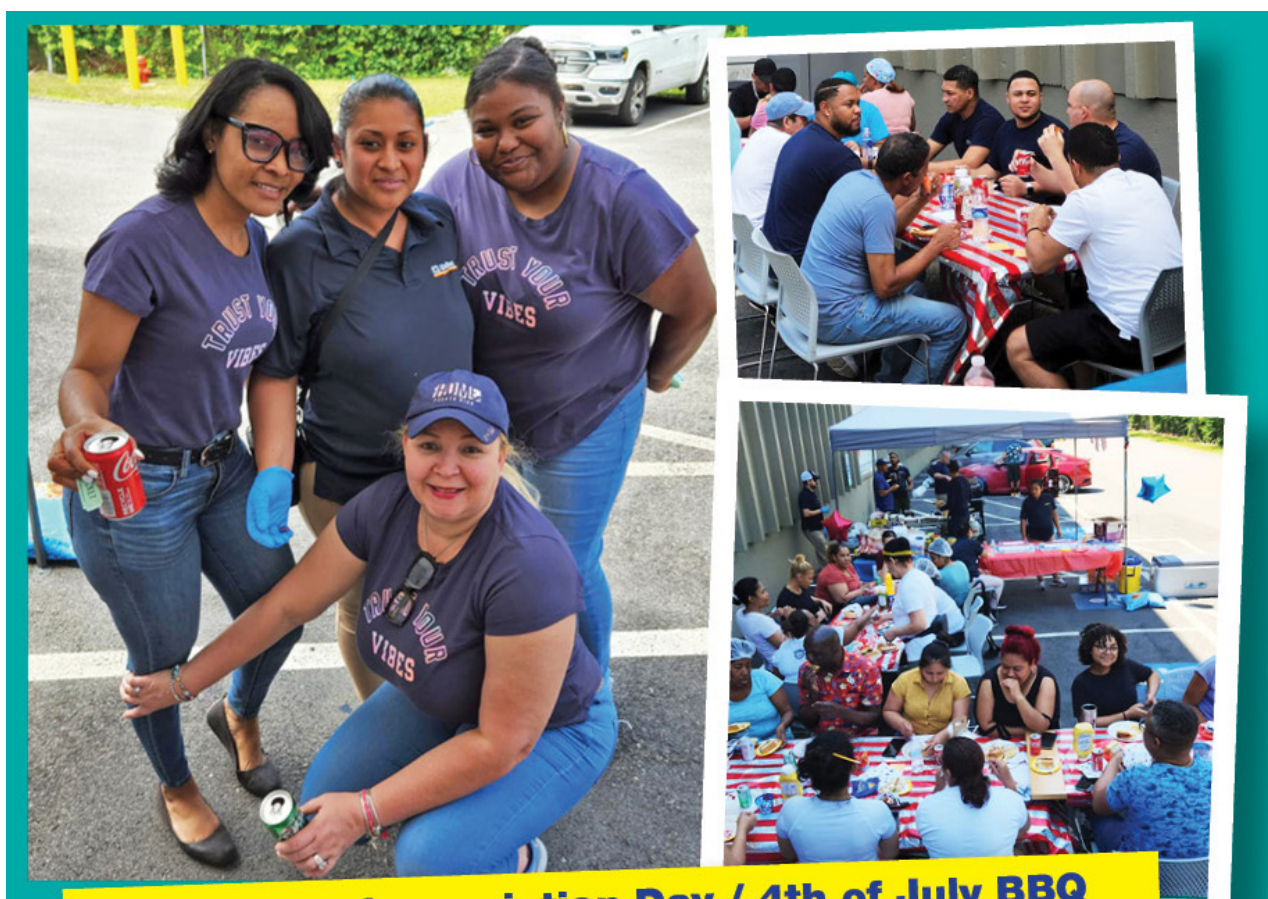
Employee Appreciation Day / 4th of July BBQ