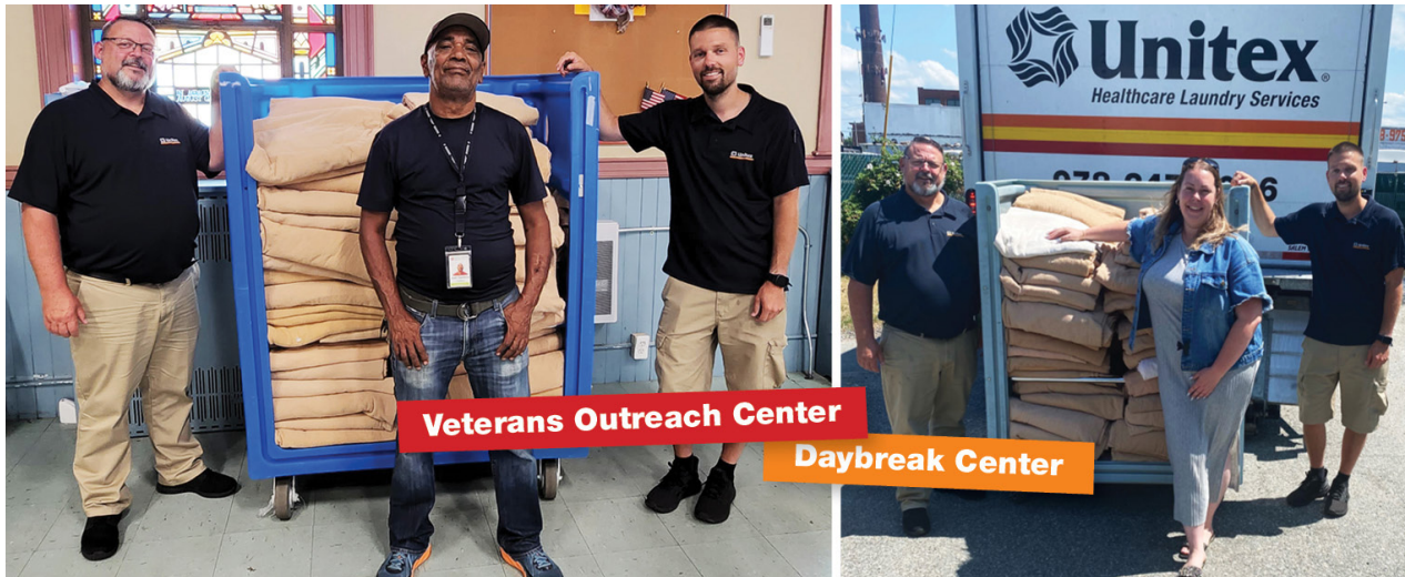
Veterans Outreach Center