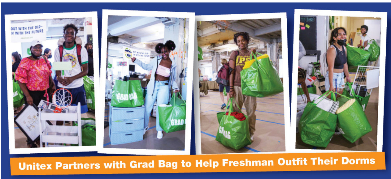
Unitex Partners with Grad Bag to Help Freshman Outfit Their Dorms