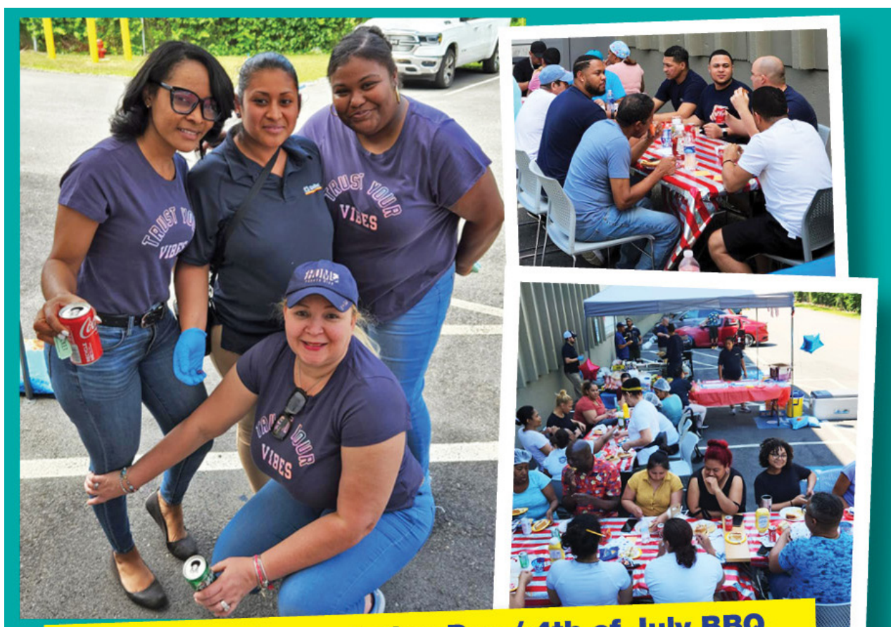
Employee Appreciation Day / 4th of July BBQ