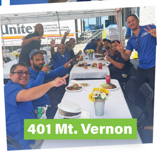
401 Mt. Vernon