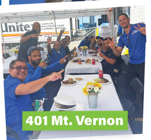
401 Mt. Vernon