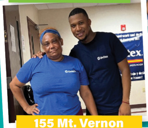
155 Mt. Vernon