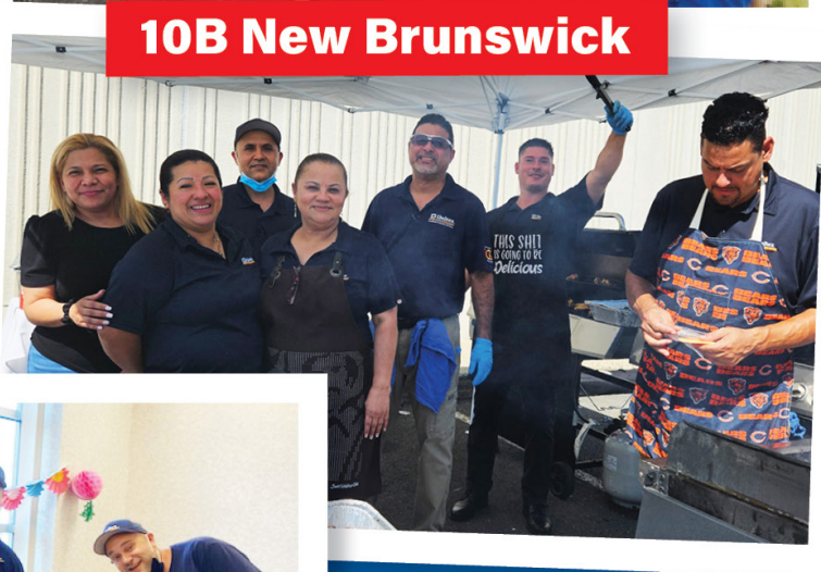
10B New Brunswick