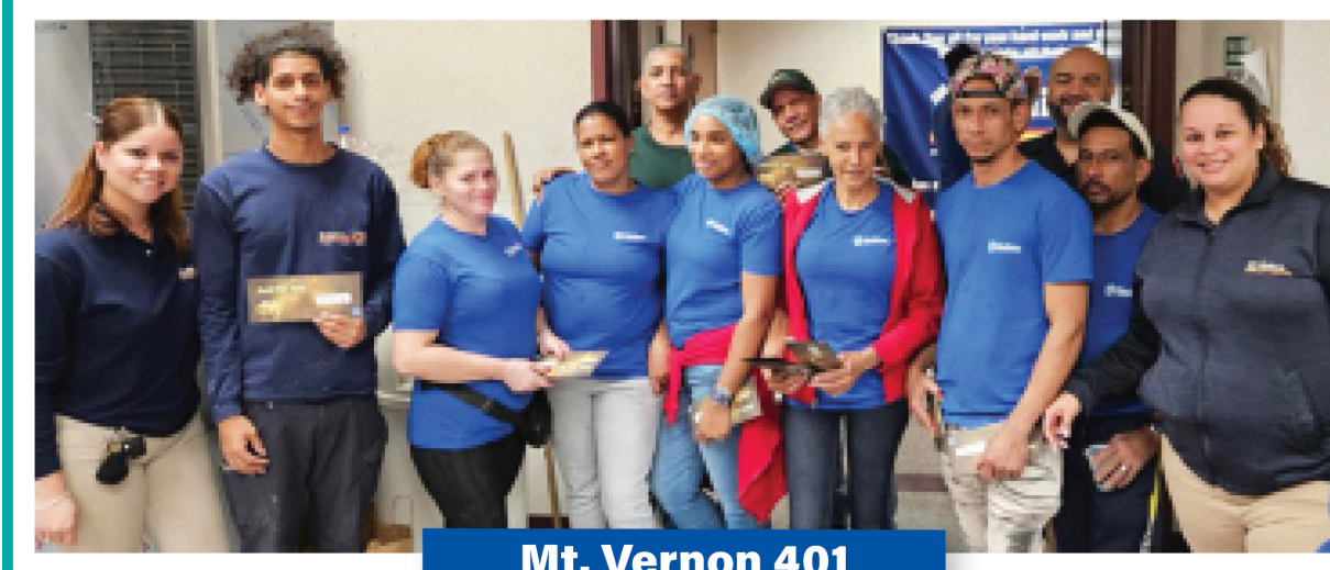
Mt. Vernon 401