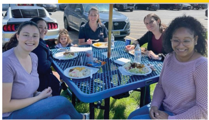
10A New Brunswick