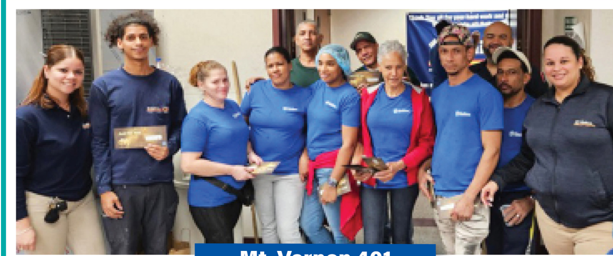
Mt. Vernon 401