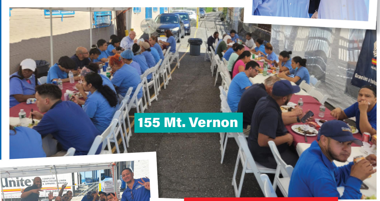
155 Mt. Vernon