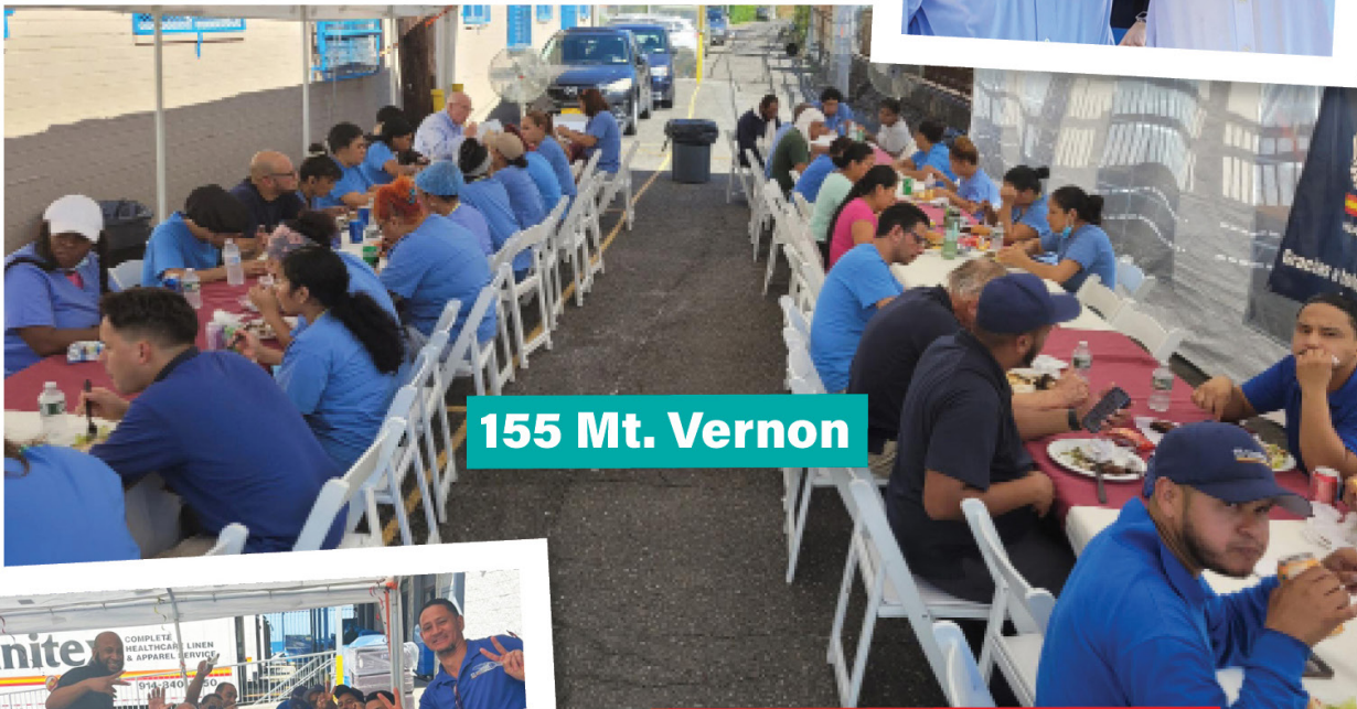
155 Mt. Vernon