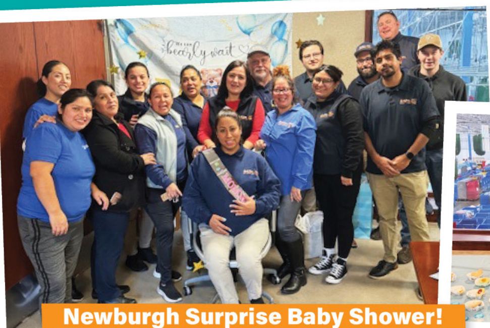
Newburgh Surprise Baby Shower!