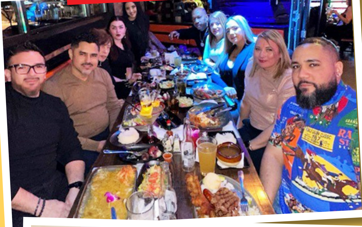
Med-Apparel, Perth Amboy

The Unitex team loves to celebrate together, but some plants had to delay their festivities until 2024 due to being too busy in December.