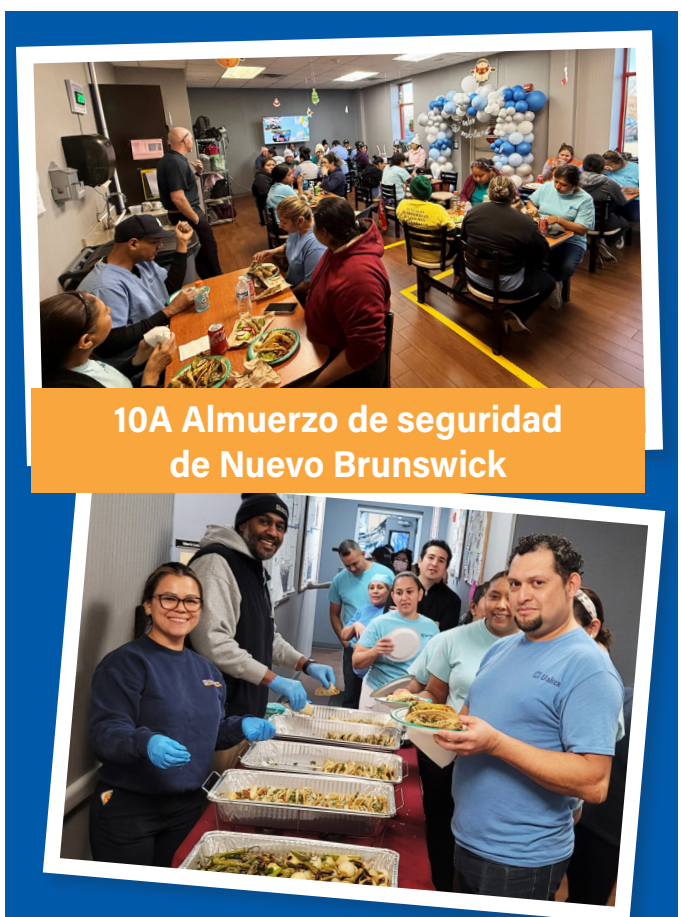
10A Almuerzo de seguridad de Nuevo Brunswick