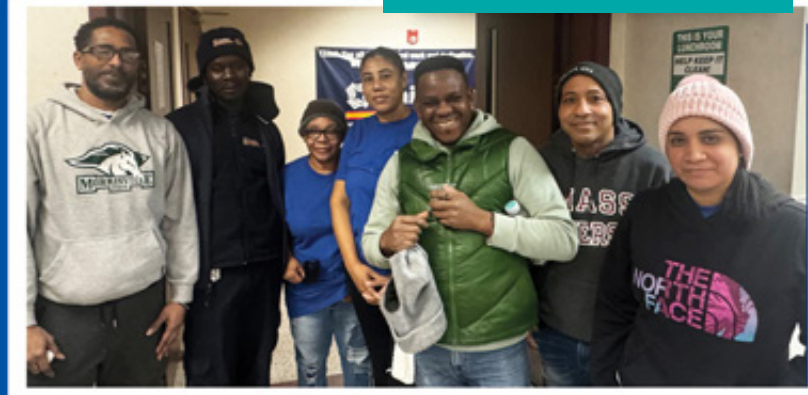
10A New Brunswick