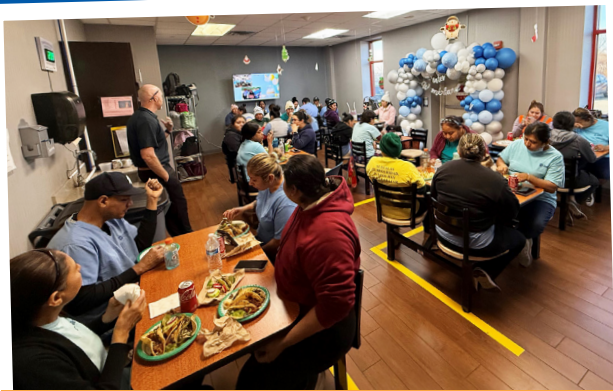
10A New Brunswick Safety Lunch