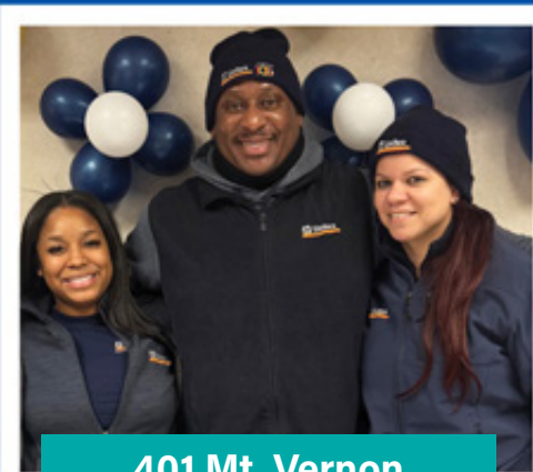
401 Mt. Vernon