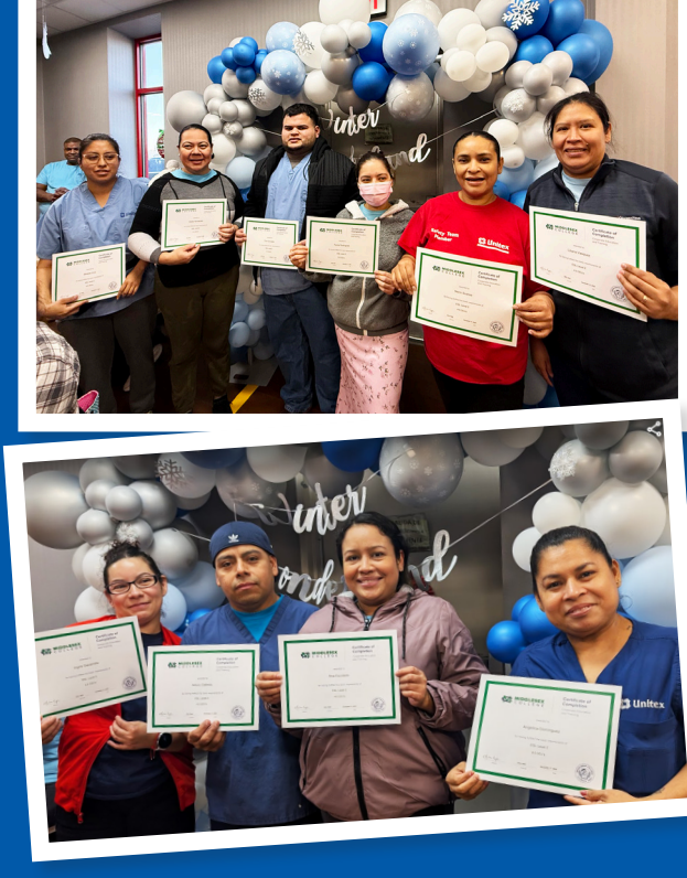
Ganadores del certificado ESL