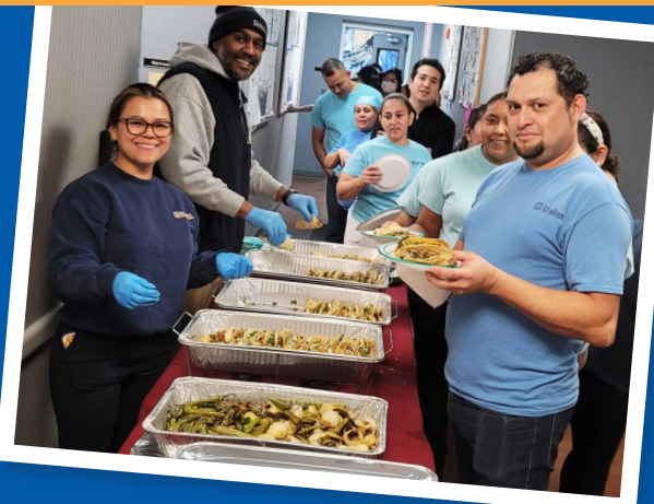
ESL Certificate Awardees