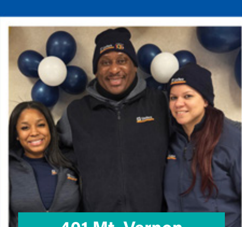
401 Mt. Vernon