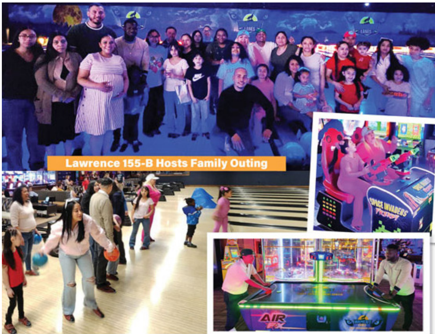
Lawrence 155-B Hosts Family Outing