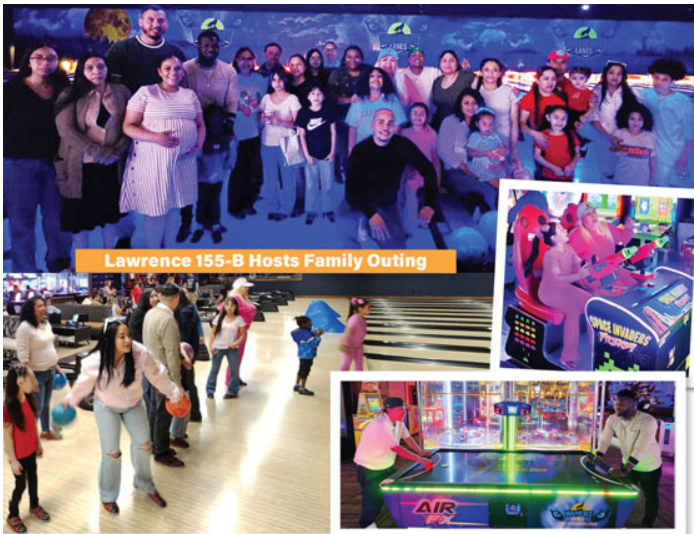
Lawrence 155-B Hosts Family Outing